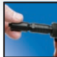
Szybko-rozłączalna obudowa części przedniej