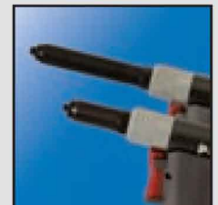
Wydłużona obudowa części przedniej