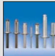
Żądaj tylko oryginalnych nitów POP ®