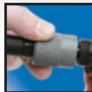
Szybko-rozłączalna konstrukcja prowadnicy szczęk