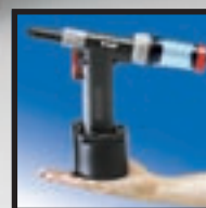
Lekka i wygodna w użyciu